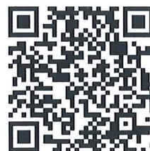
๑) โครงการ